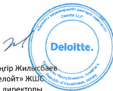
Жәңгір Жилысбаев «Делойт» ЖШС бас директоры

Қазақстан Республикасында аудиторлық қызметпен айналысуға №0000015 мемлекеттік лицензия, сериясы МФЮ – 2, Қазақстан Республикасы Қаржы министрлігі 2006 жылғы 13 қыркүйекте берген